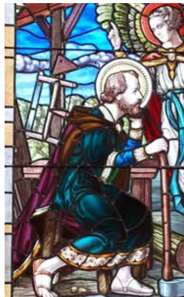
Vitrail de la chapelle de la Sainte Famille à Alex